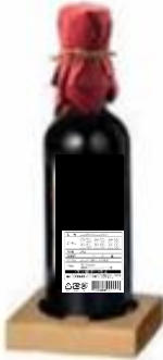
食品表示の貼り付け場所がわかる写真