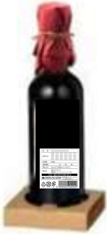
食品表示の貼り付け場所がわかる写真